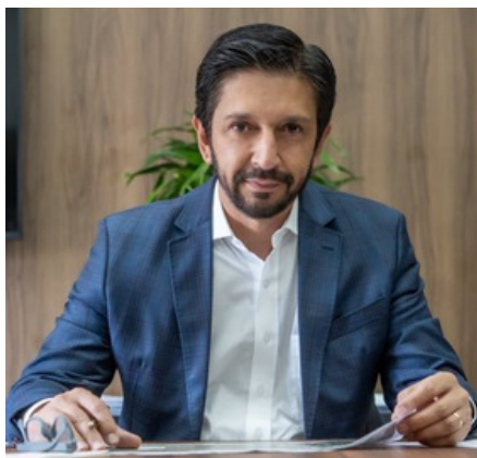
Palestra do Prefeito Ricardo Nunes