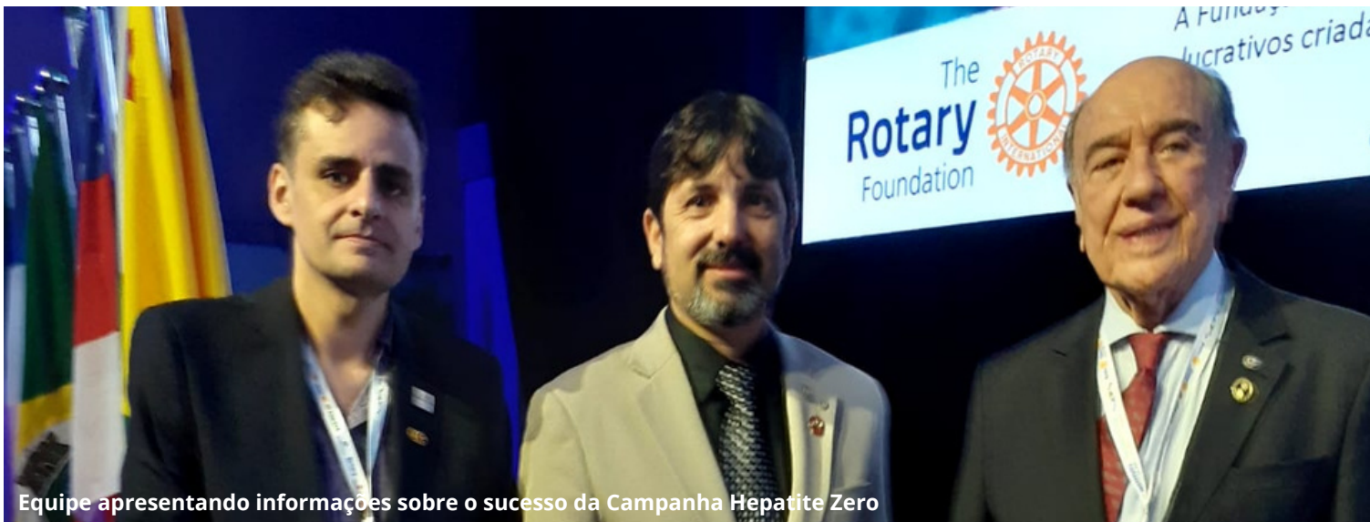
Equipe apresentando informações sobre o sucesso da Campanha Hepatite Zero