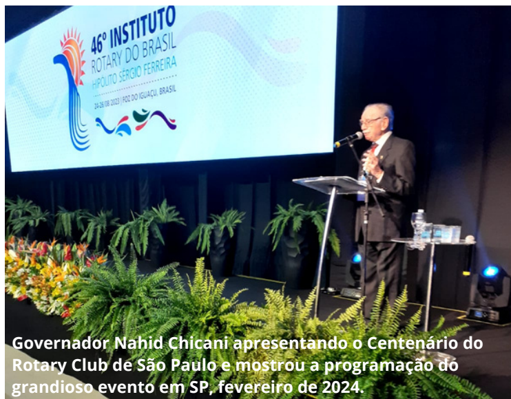
Governador Nahid Chicani apresentando o Centenário do Rotary Club de São Paulo e mostrou a programação do grandioso evento em SP, fevereiro de 2024.