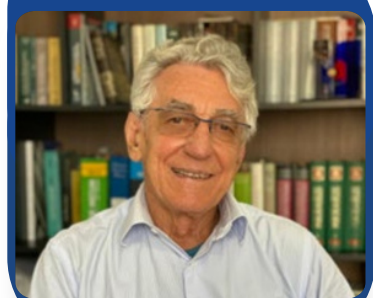
D.4610 – 1991-92